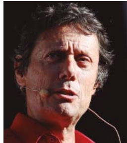
Antoine de Maximy

l'animateur voyage dans le monde entier pour... s'inviter chez les gens ! En effet, le but d'Antoine de Maximy est de gagner la sympathie des gens qu'il rencontre au cours de ses voyages pour dormir chez eux. Comme il voyage seul, cela lui permet d'entrer dans l'intimité des autochtones, de connaître leur quotidien et de partager de vrais moments avec eux. Pour que la démarche soit réalisable, il voyage léger : un petit sac à dos et deux petites caméras fixées sur les bretelles de son sac à dos pour enregistrer ses aventures. Bien sûr, les gens voient qu'ils sont filmés, mais Antoine de Maximy ne leur dit pas que c'est pour une émission de télévision, le but étant de conserver une relation la plus naturelle possible.